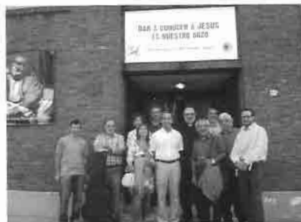
Reunión Ecueménica en diciembre