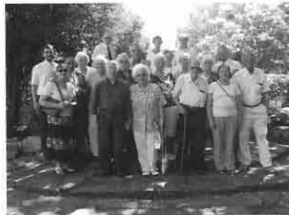
Congregación del Culto de 9:00 a 10:00